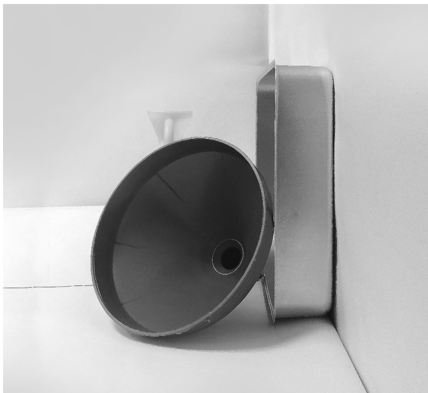
τρίτη φωτογραφία: πλάγια όψη 1