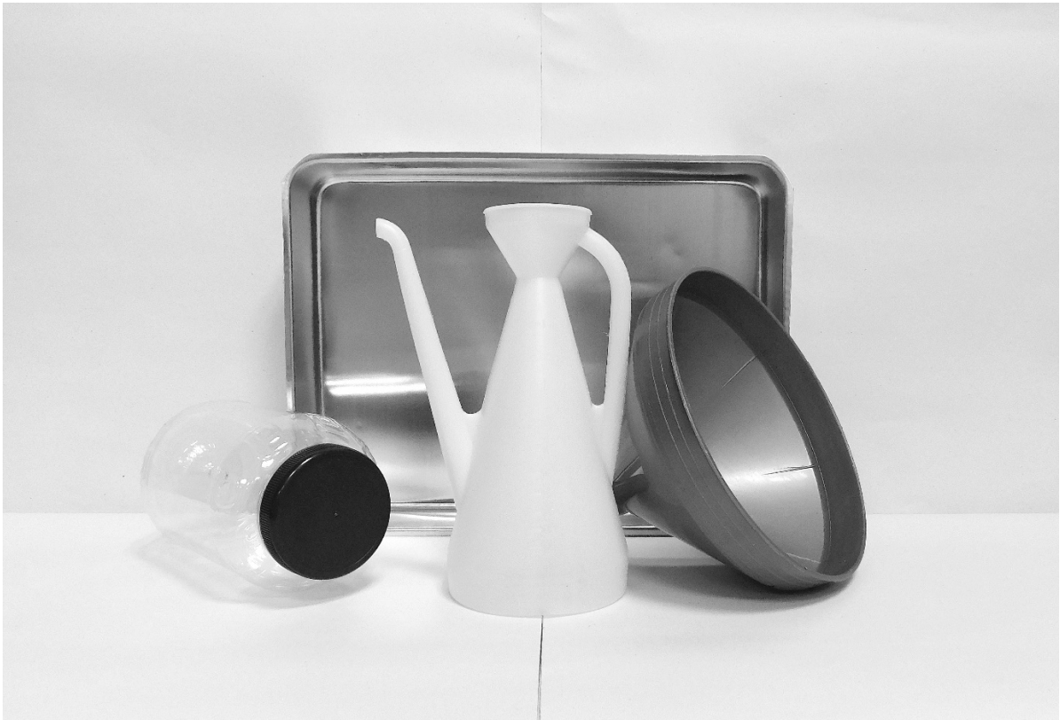
πρώτη φωτογραφία: μπροστινή όψη