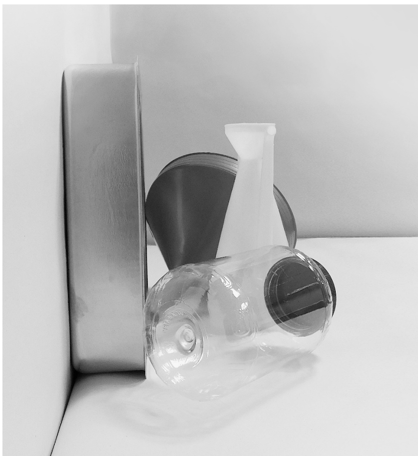
τέταρτη φωτογραφία: πλάγια όψη 2